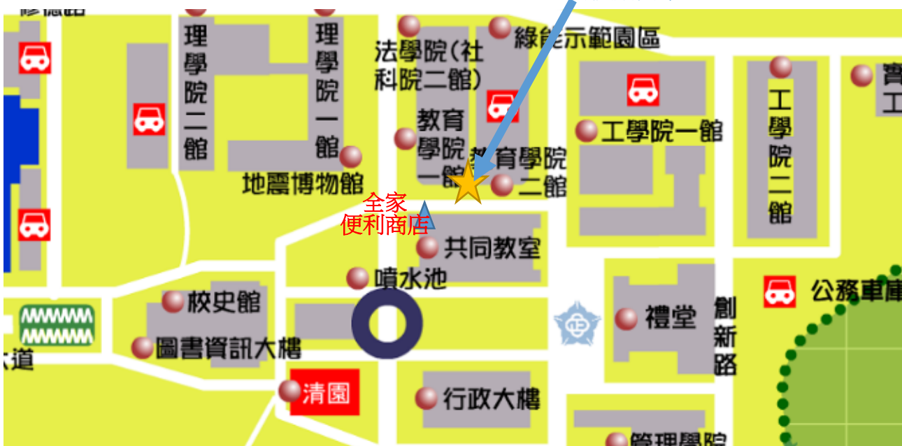
附圖一 教育學院單一入口位置示意圖

防疫期間本校實施各建築物單一出入口制度，請參考附圖一或附圖三所示位置進出教育學院。(入口位於共同教室大樓全家便利商店斜對面，教育學院一館及二館中間側門。)