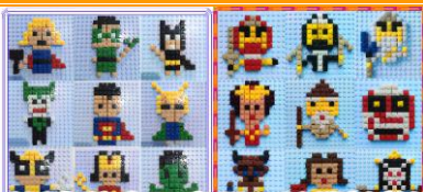
(創意積木示意圖，隨機給款)